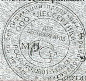
Схема сертификации – Зс по ГОСТ Р 53603-2009.